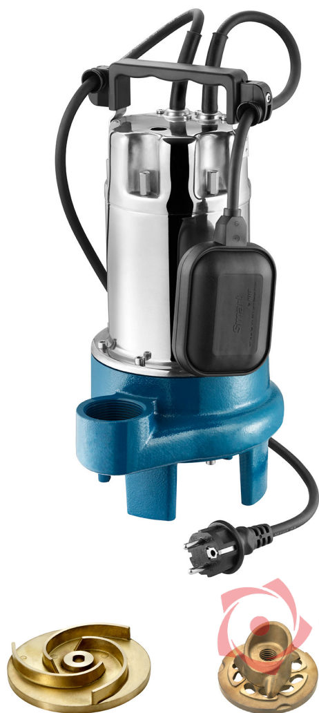
Trituratore Grinder Triturator Triturateur

Pompa da drenaggio con girante aperta caratterizzata da alta prevalenza, in rapporto al tipo e alla grandezza della macchina. Il sistema tritratore permette il pompaggio di liquidi contenenti, in sospensione, fibre tessili e corpi filamentosi da frantumare.